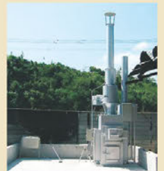
佐賀県 型枠工事業O社様 焼却物 合板