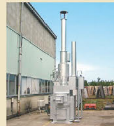
鳥取県 石材販売業S社様 焼却物 木屑

狭い敷地を有効利用。 パレットなど再生加工に伴い木屑が毎日大量に排出されるので、手狭な敷地にどんどんと溜まっていき、野積み状態になっていました。今では毎日焼却することができるので、狭い敷地を有効利用できます。